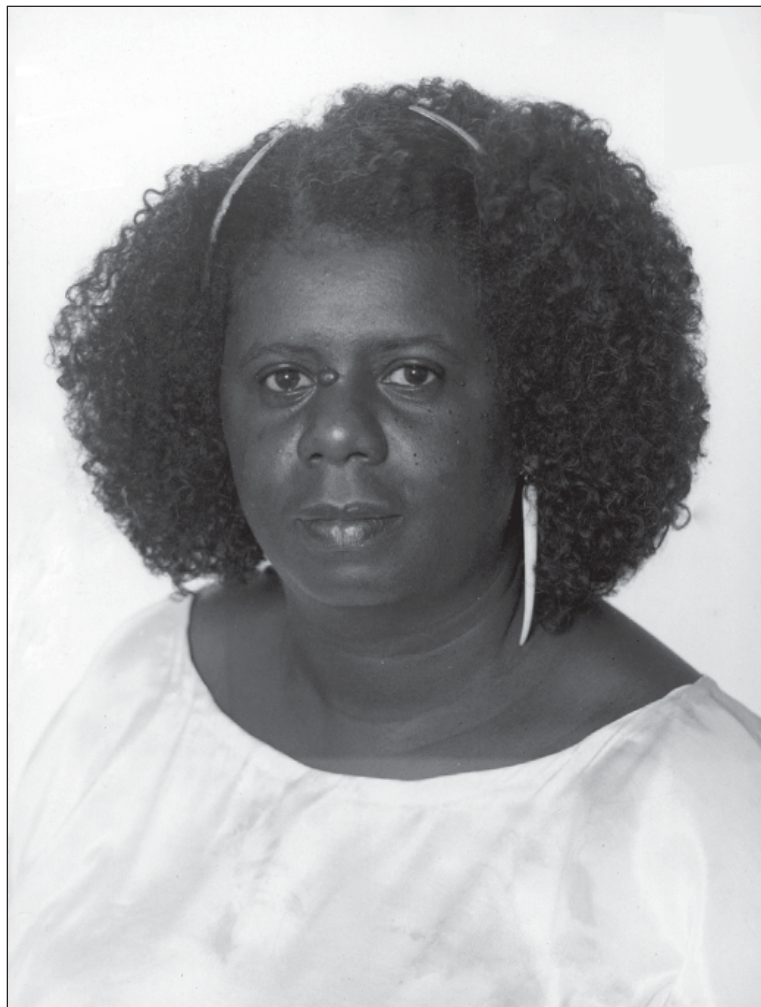
Conceição Evaristo. Uma das escritoras da série Cadernos Negros

Literatura é, antes de tudo, linguagem, construção discursiva marcada pela finalidade estética. Mesmo fazendo-se a crítica do formalismo implícito ao preceito kantiano da “finalidade sem fim” da obra de arte, e mesmo compreendendo na literatura outras finalidades para além da fruição estética, há que se ressaltar a prevalência do trabalho com a linguagem sobre os valores éticos, culturais, políti-